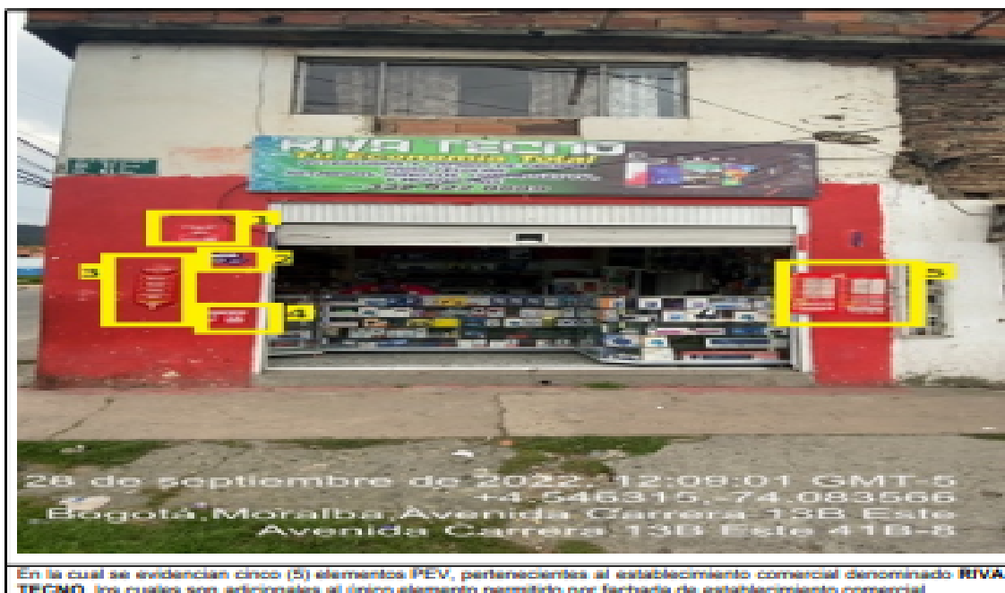
En la cual se evidencian cinco (5) elementos PEV, pertenecientes al establecimiento comercial denominado NIVA TÉCNICO, los cuales son adicionales al único elemento permitido por fachada de establecimiento comercial.